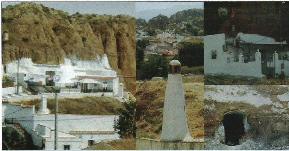
Značilni jamski domovi

danes ponujajo vodne pipe za užitek. Za to četrtjo najdemo četrt Sacromonte s tipičnimi belimi hišami. Nekatero od njih so okrašene s keramičnimi ploščicami in krožniki. Bele hiše so tudi drugače značilne za Andaluzijo, kakor tudi ozke ulice v starih mestnih jedrih. Verjetno je potem dobilo ime mesto Granada, kajti hiše so tako blizu druga drugi, kot so jedra v granatnem jabolku, ki je tudi rdeče barve, kot je