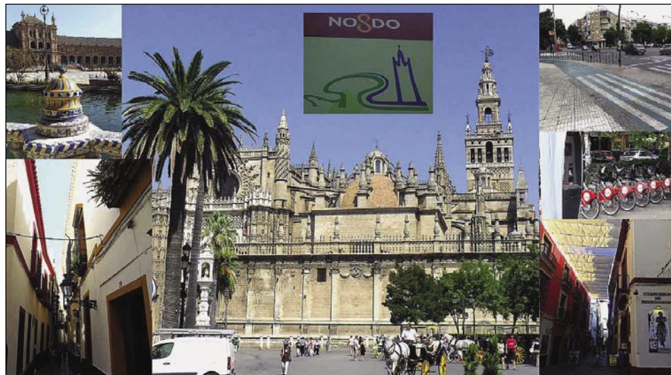
Glavno mesto Andaluzije, Sevilja z znano stavbo La Giraldo

gostje so bili zelo glasni, kar je razžalilo togo špansko gospodo in so jih zaradi tega zmerjali z besedo Flamenki, kar špansko pomeni Flamci. Pozneje se je ta izraz prenesel