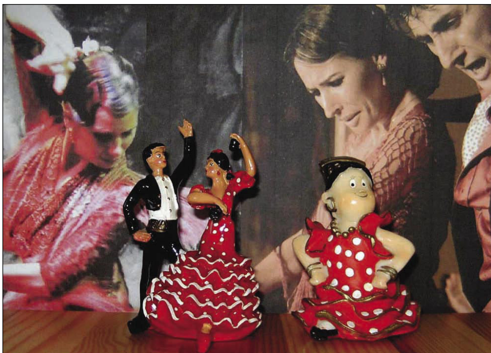
Temperamentni in strastni ples flamenko

Prvi cilj najinega potovanja je bilo glavno mesto Andaluzije, Sevilja. Že med pristajanjem letala sva opazila, da je pokrajina preveč rumenkasta. Andaluzija spada med najbolj